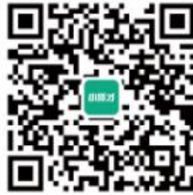
小贤才官方微信平台

七、注册信息审核通过后，通过“招聘会”进入山东工艺美术学院秋季毕业生供需见面会进行提交报名信息。报名信息可通过报名记录进行查看，或通过关注并绑定“小贤才”微信公众号账号进行接收学校相关通知。